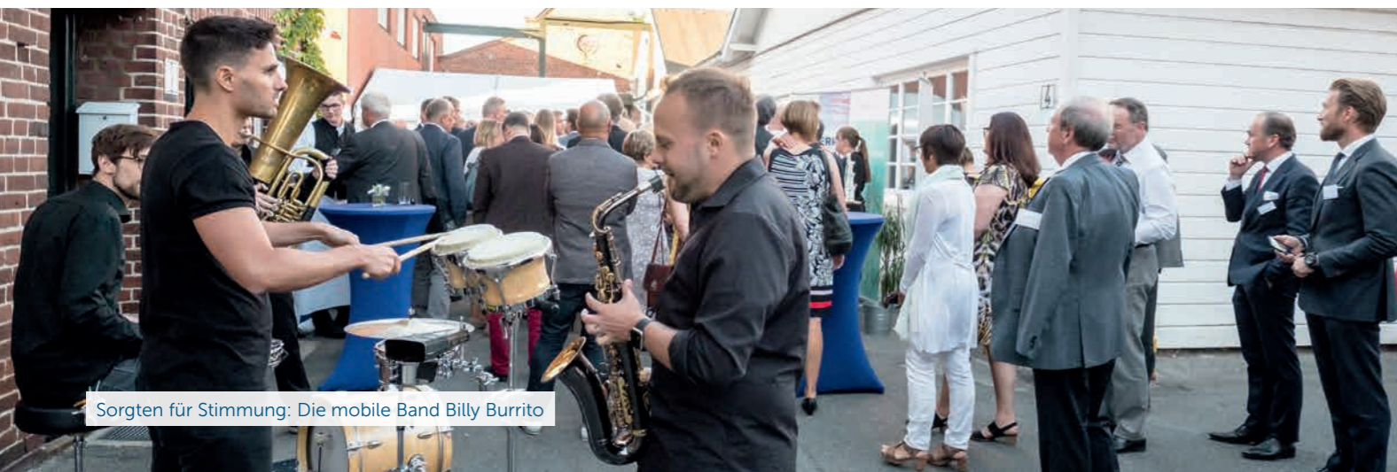
Sorgen für Stimmung: Die mobile Band Billy Burrito