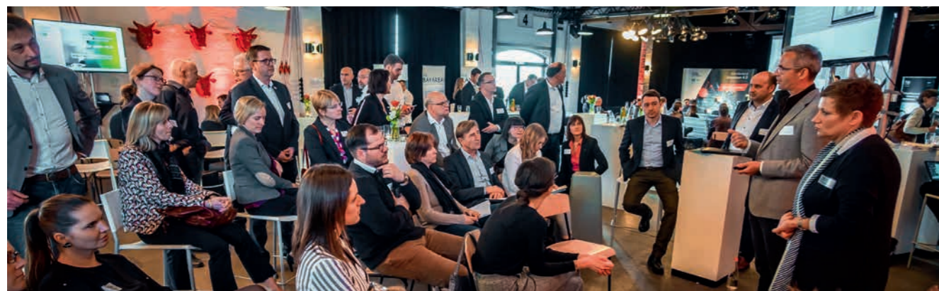
Austausch im Themencafé zu NEUES Lernen